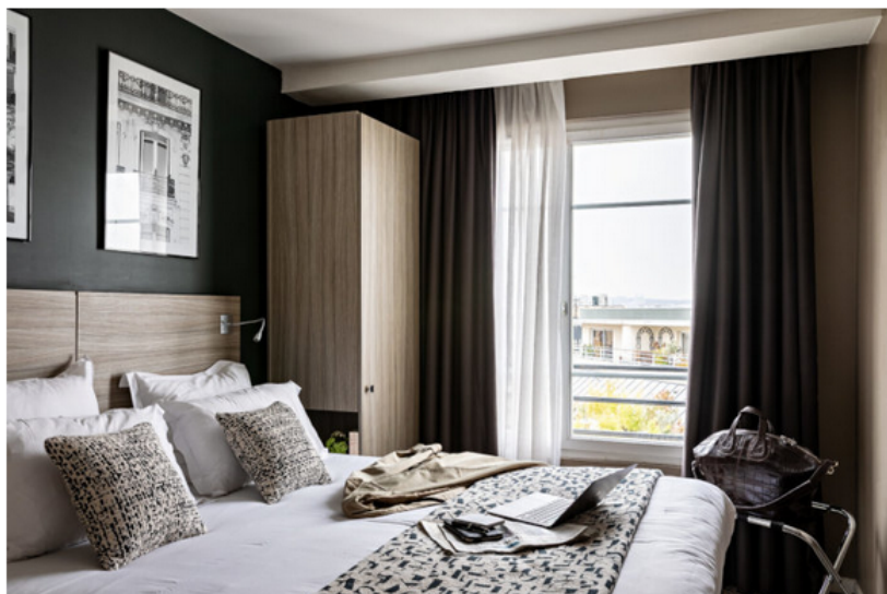
Best Western Paris Porte de Versailles.